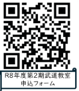
R8年度第2期武道教室 申込フォーム