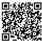
神奈川県立武道館 公式ホームページ

[住所] 〒222-0034 神奈川県横浜市港北区岸根町725 シンコースポーツ神奈川県武道館 [開館時間] 9:00~21:00 [休館日] 第2・第4月曜日(祝祭日・振替休日を除く), 年末年始, 館内整理日 [電話番号] 045-491-4321 [FAX] 045-491-2192 [メールアドレス] kanagawabudokan@shinko-sports.com