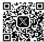
神奈川県立武道館 公式X